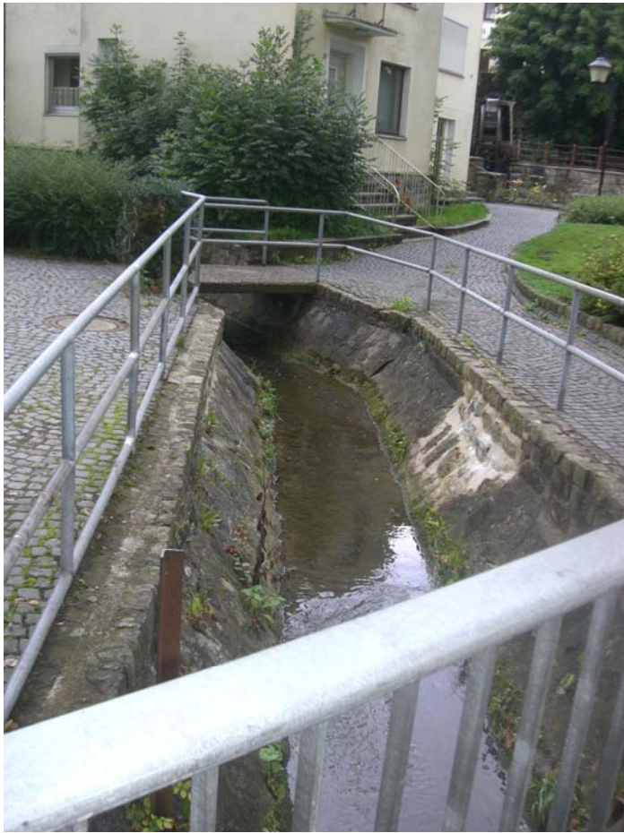
Abbildung 24: Katzohlbach mit gestalterischen und ökologischen Defiziten

Gerade nördlich der Schulen und südlich der Straße „Am Katzohlbach“ stellt er einen landschaftlich kleinräumigen aber wertvollen Bereich dar, den es zu sichern und zu optimieren gilt. Vor diesem Hintergrund ist zu prüfen, ob nicht durch Renaturierungsmaßnahmen und die Optimierung der Fußwege hier ein kleinerer Naherholungsbereich geschaffen werden kann, der sich auch auf die Gestaltung der Freiflächen an der Dringenberger Straße ausdehnen sollte.