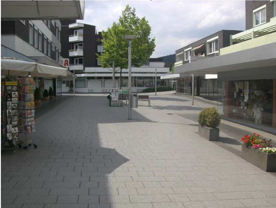
Abbildung 9: Fußgängerbereich "Am Hellweg"

Als Ergänzungsstandort zur „Lange Str.“ ist die Anpassung und die Schaffung von marktgängigen Geschäftsgrößen in diesem Bereich notwendig. Dabei ist bzgl. der Sortimente auf eine Ergänzung der vorhandenen Sortimente an der „Lange Str.“ zu achten. Denkbar sind hier Fachmärkte und größere Einzelhandelsbetriebe als Alternative zur Südstadt.