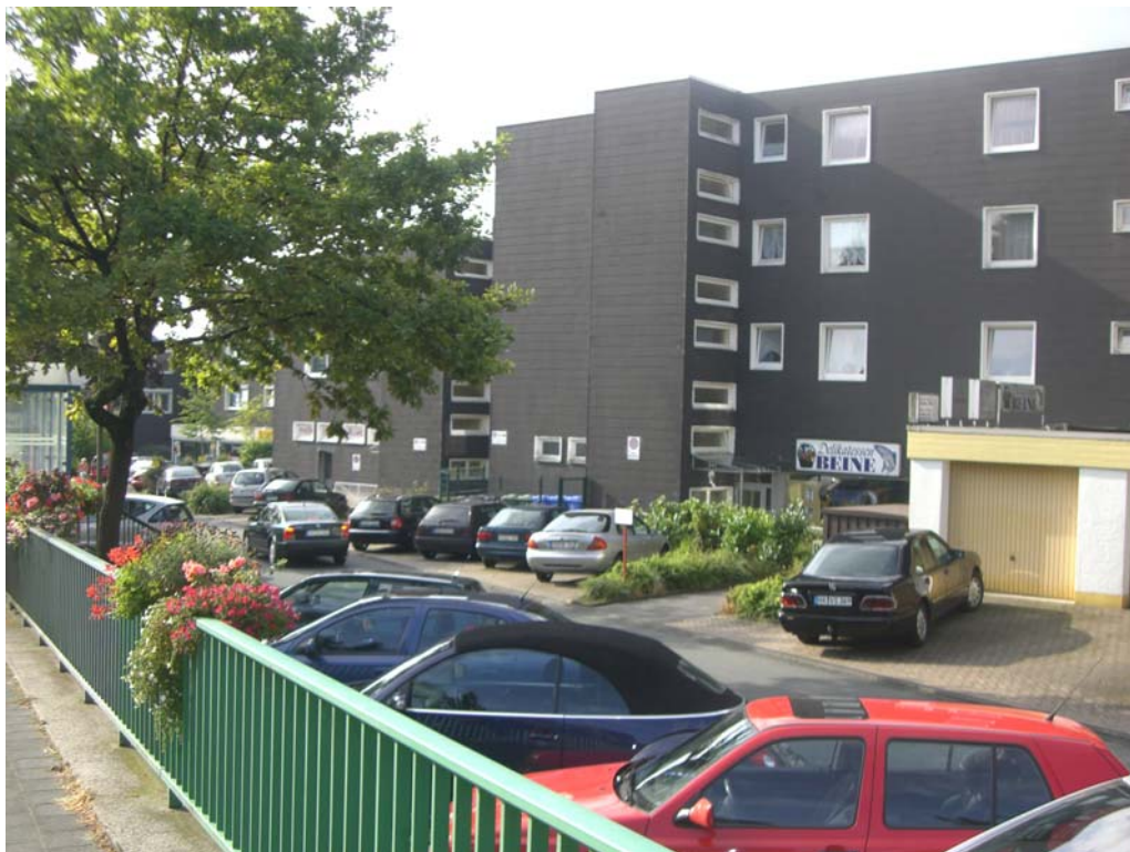
Abbildung 19: 70er Jahre Bebauung südlich des Adenauer-Ringes zur Fußgängerzone hin

Westlich der „Lange Straße“ zum Katzohlbach hin stellt sich eine andere städtebauliche Situation dar. Die Straße „Am Katzohlbach“ bildet den Abschluss der zentralen Lage und dient als rückwärtige Erschließung der „Lange Straße“. Interessante fußläufige Verbindungen erhöhen hier nicht nur die Erreichbarkeit wichtiger Einrichtungen und der Ladenlokale sondern stellen auch die Verbindung zu den südlich gelegenen Siedlungsbereichen dar. Gestalterische und damit auch funktionale Defizite weist hier allerdings das Areal im Einmündungsbereich der Straße „Am Katzohlbach“ mit der Dringenberger Straße auf.