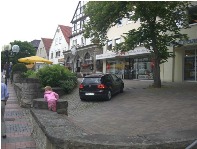
Abbildung 14: östliche "Lange Straße": Gestaltungsdefizite

Neben Dienstleistungs- und Gastronomieeinrichtungen erscheint aber auch eine Entwicklung zu einem attraktiven innerstädtischen Wohnstandort sinnvoll. Zum einen bietet der Bereich in seinen Randbereichen wie Südstraße oder Kolpingstraße die Chance, relativ ruhig und doch zentral zu wohnen.