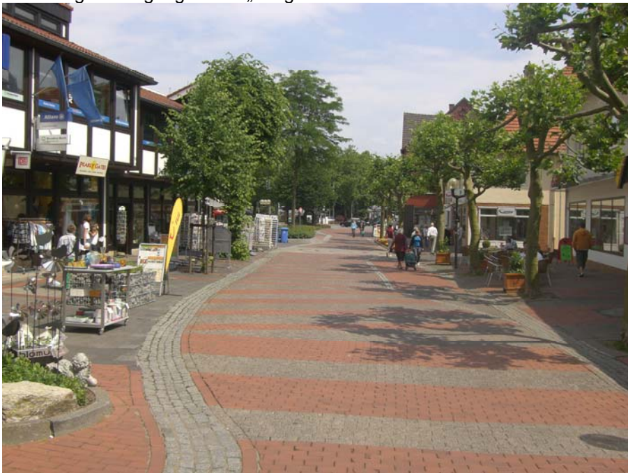
Abbildung 8: Fußgängerzone „Lange Straße“

gleichzeitig kann eine solche Umgestaltung als Initialzündung für private Investitionen in das Erscheinungsbild der Gebäude und Ladenlokale verstanden werden.