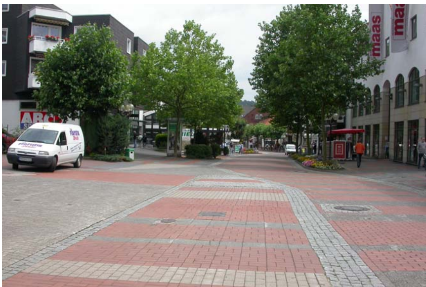
Abbildung 2: unattraktive und nicht mehr zeitgemäße Gestaltung der "Lange Straße"

Diese Entwicklung ist besonders im Bereich der „Lange Straße“ zu beobachten. Ein unattraktiver Straßenraum mit zum Teil erheblichen baulichen Mängeln trägt hier entscheidend zu einem Verlust der Aufenthaltsqualität bei.