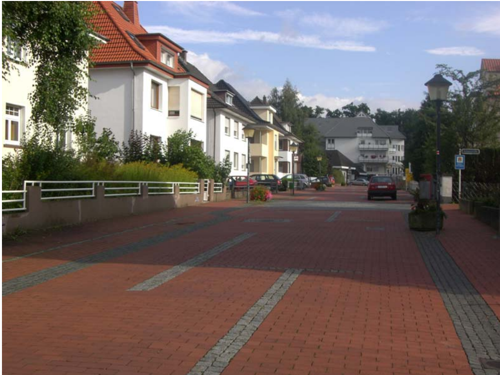
Abbildung 22: fehlende Gliederung Caspar-Heinrich-Straße

Zu hinterfragen ist vor diesem Hintergrund die Lage und Ausgestaltung der Unterführung. Sinnvoller erscheint es, diesen Siedlungsbereich, in dem sich innenstadtnahes altersgerechtes Wohnen etabliert über den Kreuzungsbereich „Lange Straße“/Adenauer-Ring anzubinden. Damit könnte eine zweite Achse zwischen Zentrum und Kurpark entstehen, die als „ruhige“ Achse eine ideale Ergänzung der „Erlebnis“-Achse Lange Straße darstellen würde.