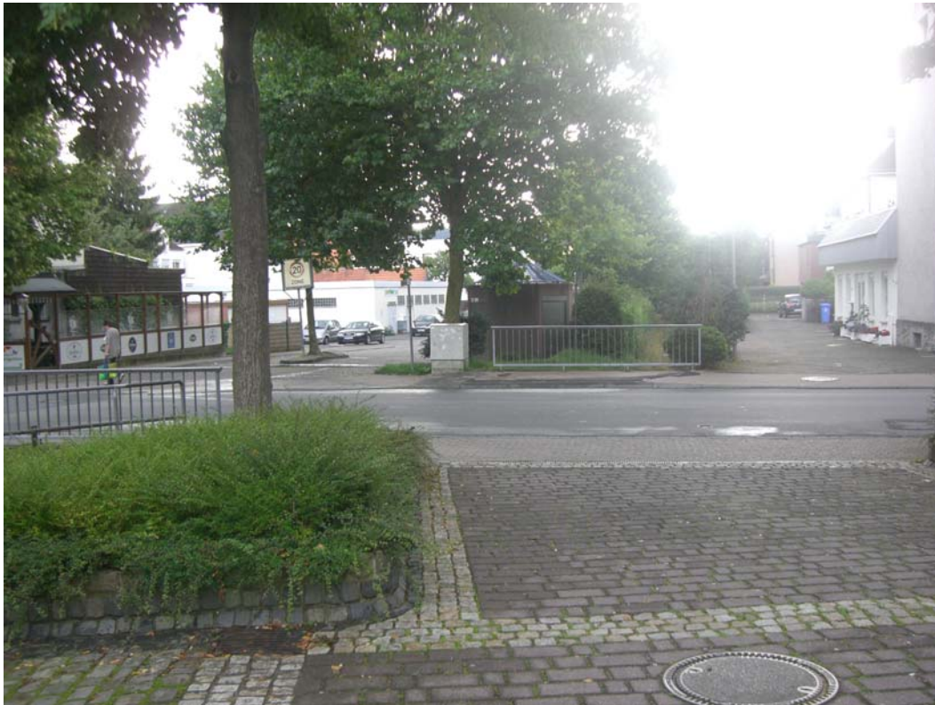
Abbildung 20: Dringenberger Straße/Am Katzohlbach: Gestaltungsdefizite

Als zentrumsnaher Platz mit Parkmöglichkeit sollte hier eine gestalterische Aufwertung als Übergangsbereich zur Innenstadt vorgenommen werden. Denkbar ist hier auch die Integration des eigentlichen Katzohlbaches.