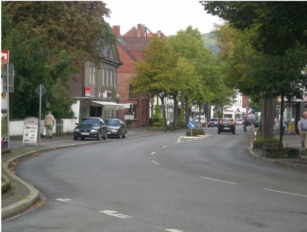
Abbildung 25: Alleearartige Bepflanzung im östlichen Bereich der "Lange Straße"

Aufgrund der beengten Platzverhältnisse im Kernstadtbereich ist es sinnvoll, hier punktuelle Begrünungsmaßnahmen durchzuführen, die neben einer Orientierungsfunktion auch das Stadtbild positiv beeinflussen. Die „Lange Straße“ kann durch zusätzliche Baumreihen so als Allee ausgebildet werden.