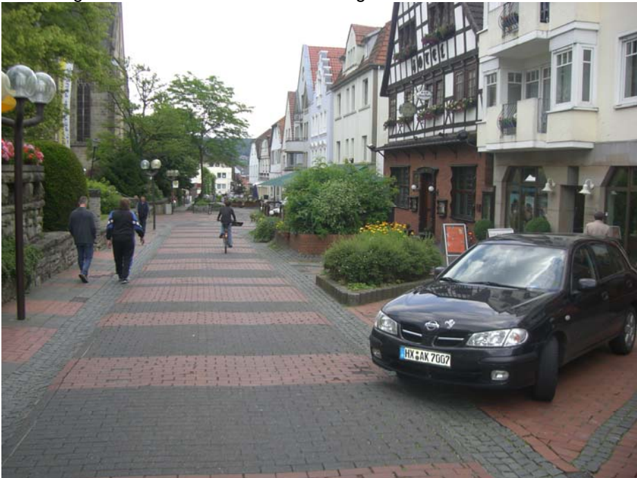
Abbildung 10: westlicher Abschnitt der "Lange Straße"

Durch Gestaltung des Straßenraumes kann sich dieser Abschnitt aber zu einem qualitativ hochwertigen innerstädtischen Bereich entwickeln und so als „lebendiger Treffpunkt“ für Besucher und Touristen aber auch für Bewohner Bad Driburgs entwickeln.