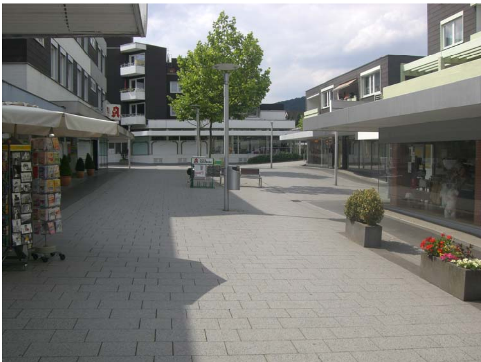
Abbildung 18: fehlende Raumkanten im Bereich "Am Hellweg"

Dieser Teilbereich ist zwar städtebaulich ansprechend gestaltet, allerdings bilden hier die aus den 60er/70er Jahren stammenden Baukörper keine Raumkanten, trotz der Zentralität sind funktionale Defizite vorhanden, die u.a. darin begründet sind, dass dieser Bereich nicht wahrgenommen wird.