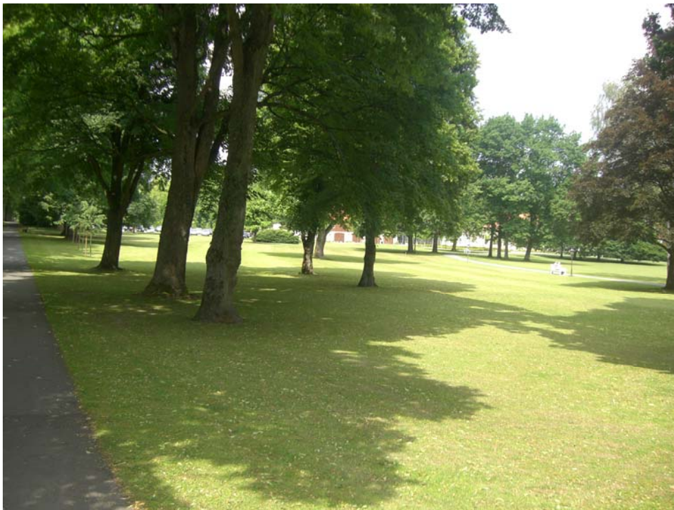
Abbildung 23: Prägende Grünzone Kurpark

Erwähnenswert ist neben dem Kurpark aber auch der Bereich des Katzohlbaches, der als verbindendes Grünelement zwischen dem östlichen und westlichen Siedlungsgebiet am Rande der Innenstadt Defizite in seiner Ausformung und Funktion aufweist.