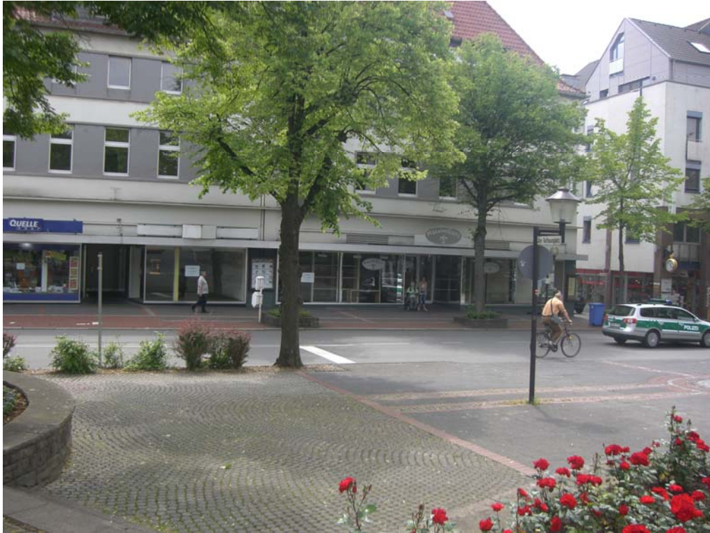
Abbildung 21: Rathausvorplatz: Gestaltungsdefizite und Leerstand

Der Abschnitt verfügt darüber hinaus weiter nach Osten führend mit dem vorhandenen Baumbestand und der auf der Nordseite vorhandenen Bebauung über ein großes Potenzial, diesen Straßenabschnitt als belebte attraktive Verbindungsachse zwischen den Kureinrichtungen/Kurpark, dem Bahnhofsbereich und dem engeren Zentrum auszubauen und zu aktivieren.