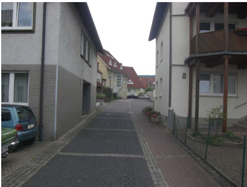
Abbildung 15: Wohnbereiche in unmittelbare Nähe der "Lange Straße"

Neben Dienstleistungs- und Gastronomieeinrichtungen erscheint aber auch eine Entwicklung zu einem attraktiven innerstädtischen Wohnstandort sinnvoll. Zum einen bietet der Bereich in seinen Randbereichen wie Südstraße oder Kolpingstraße die Chance, relativ ruhig und doch zentral zu wohnen.