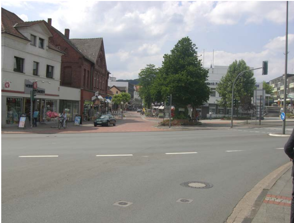
Abbildung 17: nichtwahrnehmbarer "Eingang" zur Fußgängerzone von Osten

Mit einer solchen Aufwertung geht auch die Zielsetzung einher, den sich nördlich an die „Lange Straße“ anschließenden Bereich des „Hellwegs“ besser in das Stadtzentrum zu integrieren.