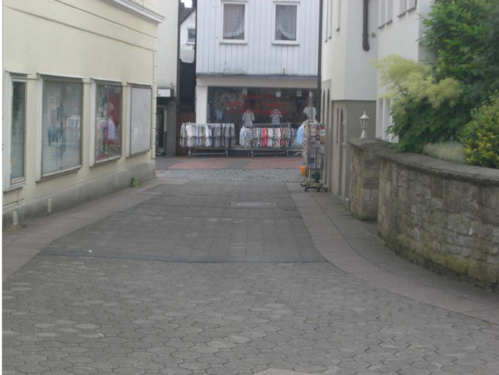
Abbildung 16: Wegeverbindung zwischen "Lange Straße" und Wohnbereichen

Darüber hinaus bietet die Schaffung von attraktivem innerstädtischem Wohnraum auch die Möglichkeit, grundlegende Renovierungen und Umbaumaßnahmen an den Gebäuden vorzunehmen um so den sich abzeichnenden Verfall einzelner Gebäude entgegenzuwirken.