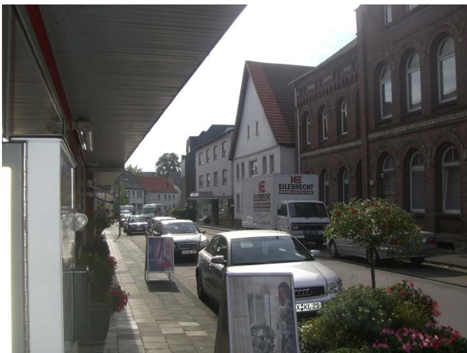
Abbildung 13: Mindernutzung und ungestalteter Straßenraum an der Schulstraße

Mindernutzungen und Leerstände z.B. in der alten Schule an der Schulstraße führen dazu, dass der Bereich städtebaulich unattraktiv wird.