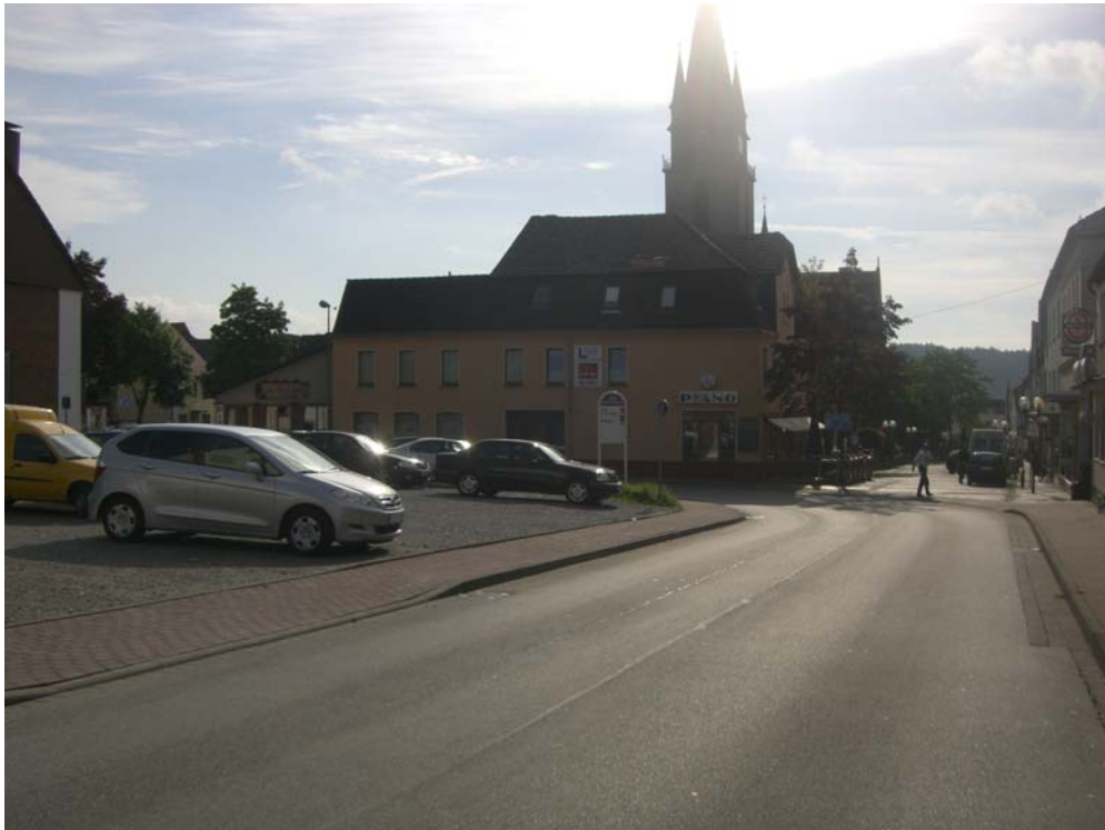
Abbildung 12: fehlende Raumkante „Lange Straße“ / Pyrmonter Straße

Es fehlt im Straßenraum an einer deutlichen Kennzeichnung dieses Bereiches, so dass er als historischer Stadtkern nicht ohne weiteres erkennbar ist. Ein Beispiel bildet hier der Parkplatz Ecke Pyrmonter Straße/„Lange Straße“. Die vorhandenen Raumkanten werden hier unterbrochen, so dass gestalterische Defizite auftreten, die den westlichen Eingangsbereich in den Ortskern verwischen.